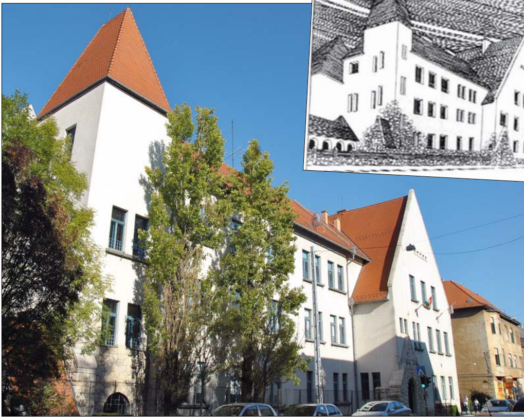
A Városmajor utcai iskola festői épületegyüttese