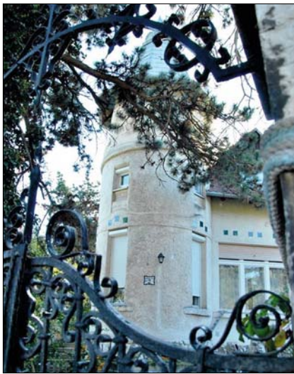
...és ami végül megvalósult belőle

rákosliget telepe. A Hegyvidéken, a Kissvárbegy alján a Virányossal egy időben, 1910 és 1913 között jött létre az Árka Aladár által tervezett Bírák és ügyészek telepe. A virányosira és erre is jellemző a szecessziós stílusjegyek