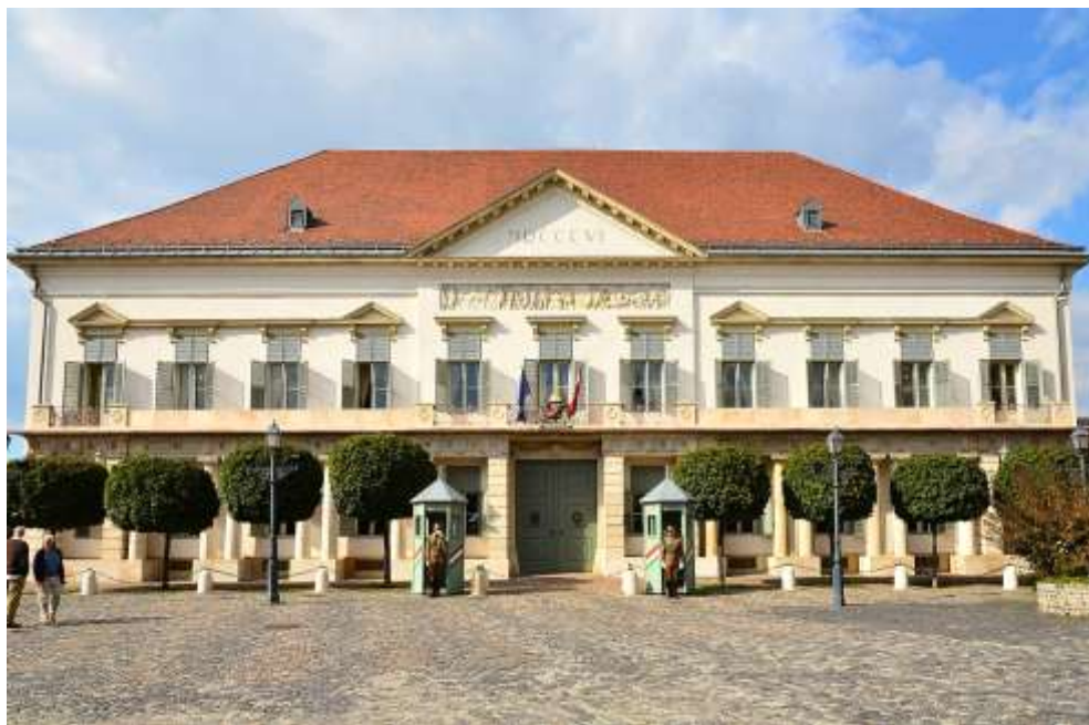
Kép: A Sándor- palota (Budapest)-Wikipédia