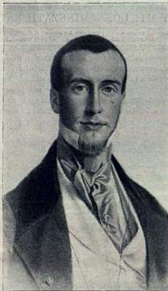
Egykorú képe a társai.

Az intendánságról való lemondása után az Adria biztosító-társaság magyarországi osztályának igazgatója lett, a mellett folytatva munkásságát a közmunkatársaságban s a képviselőházban is. A parlamentben nemcsak a legérgebb, hanem a legnépszerűbb tagok egyike is. Bár nem tartozott soha a gyakori és szapora beszédű szónokok közé, felszólalásait mindig józan ítélet, tárgyismeret jellemezte. Újabb időben már igen ritkán hallatja szavát a házában, de azért pontos látogatója az üléseknek. A szabadelvűpártiak, már évek sora óta elnöke s az a köztisztelő és népszerűség, melyet hosszú élete alatt szerzett, nem egy nehéz pillanatban vált a pártiak nagy hasznára. A mi sajtószereplésünkön közt gyorsan megörömlőnek az emberek, idő előtt; Podmaniczky mind mostanáig érintetlen maradt, megvédte őt a legrosszabb vértézet: kortársainak szeretete és tisztelése.