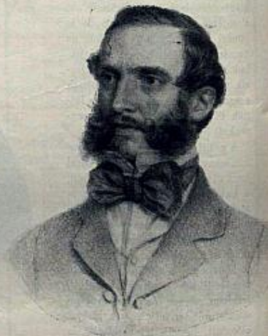
Budapesti rajza a társai.