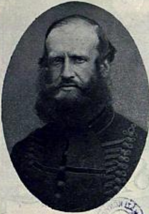
BÁRÁNY PODMANICZKY FRIGYES 1864-BEN.

Pesten, majd Késmárkon. Ezután, mint gróf Ráday Gedeon pestmezei követ irnoka az 1843-44-iki pozsonyi országgyűlésre ment, 1846 márciusában pedig a berlini egyetemet kereste fel. Egy évi külföldi tartózkodása után, mely alatt bentarta Dán-, Svéd- és Oroszországot, hazatérve ifjú lelkesedéssel vetette magát az akkori pezsgő politikai élet sodrába. A gróf Batthyány Lajos és Kossuth vezérlete alatt állott ellenzék burgó híve lett s — naplója szavai szerint — „pályáját társadalmi ügy-nökként kezdte, mint kortesvezér folytatta, majd az 1847-48-iki és 1848-iki országgyűléseken mint a főrendiház tagja s korjegyzője folytatta.” Erőteljes társadalmi szereplése volt, mint a nemzeti érzésű főúri ifjúság egyik vezérének, az a mozgalom, mikor a császárs-tánczot meghonosították a pesti úri bálokon. Mint kortes különösen 1847 októberében tüntette ki magát, mikor Kossuthot Pest megye követének választották az akkori összehívott országgyűlésre. Különösen az Aszódi-vidéki választók között korteskedett nagy lelkesedéssel és sikerrel s mikor a választók bevonultak a fővárosba, ott lovagolt ő is az élükön, a többi kortes-vezérrel együtt, czifra szürbe, lobogó gyolcs ingbegatyába öltözve. A választás fényes sikerében jó része volt neki is.