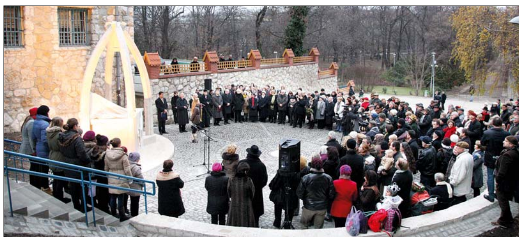
Méltó helyre, a Kós Károly iskola szomszédságába került az ünnepélyes keretek között felavatott szobor

„A leglátványosabb változások a park közepébe, sportolásra kijelölt részén történtek” – emelte ki a polgármester. Itt épült fel Magyarország első parkour-pályája, ahol a fiatalok biztonságos körülmények között gyakorolhatják akrobatikus mutatványaik. Ezenkívül új, szabadterei fitnessgépek és pingpongasztalok, valamint focipályák várják a sportolni vágyókat a megszépült Városmajorban.