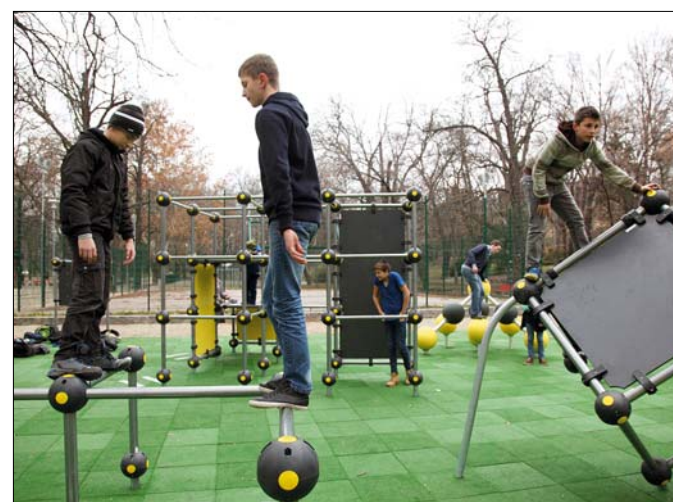
Magyarország első parkour-pályája

A főváros 150 millió forintos támogatásával – amihez a kerület további 50 milliót tett hozzá –, a látogatók igényeire igazodva, számos fejlesztés történt a parkban. Sétányokat, zöldfelületeket újítottak meg, valamint átépült a templom mögötti terület, ahová formatervezett padok, sakkasztalok kerültek ki. Az Ignotus utca melletti területen új, zárt kutyafuttató épült, továbbá bekerítet-