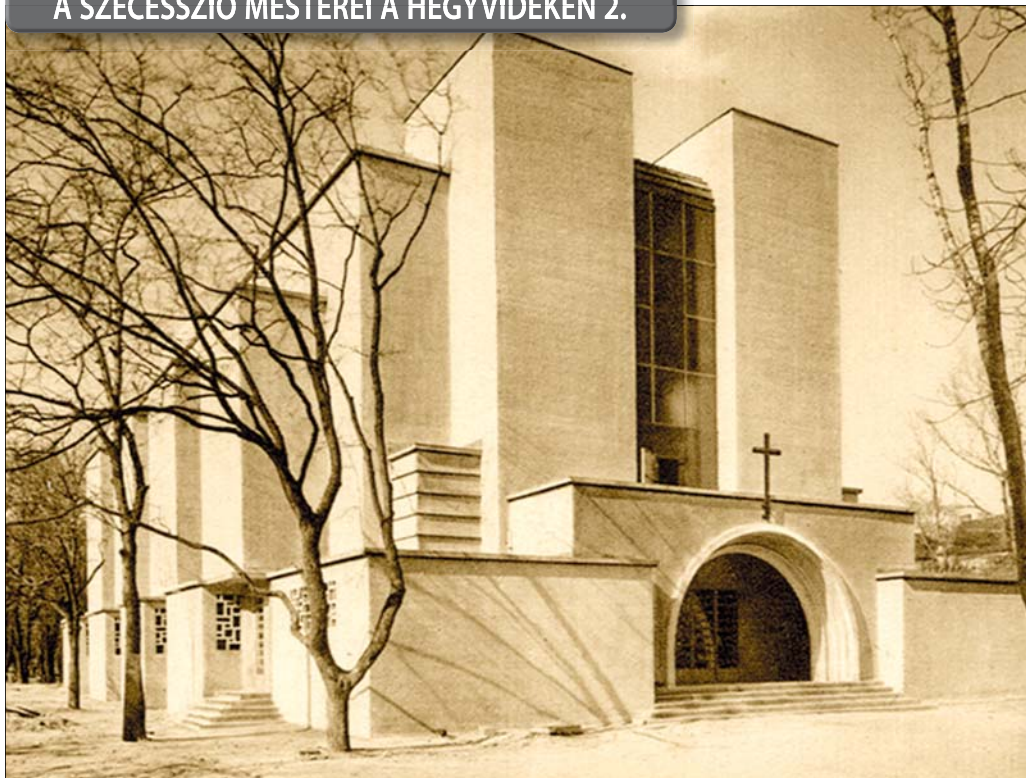
A Városmajori Jézus Szíve Plébániatemplom