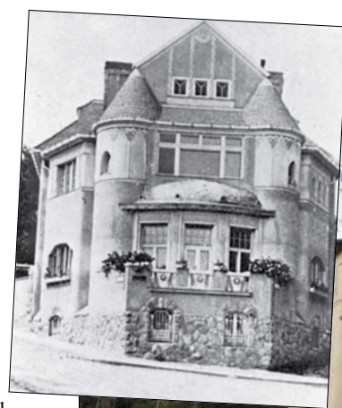
Árkay családi háza az Alma utca 1. alatt

Az építészeti hatást társzművészetek erősítik. A főhomlokzat kapuzatát díszítő anyagok Ohmann Béla domborművei. A szentélyt határoló öt magas ablaksáv ólomüveg betéte eredetileg Árkayné Sztello Lili alkotása. A szentély oldalfalain Árkay Vilmos hatalmas képei láthatók.