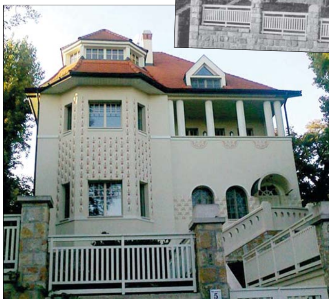
Tóth Lőrinc utca 5. (Stiene János egykori háza)