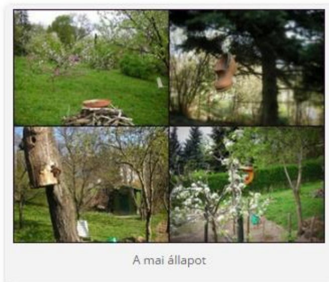
A mai állapot

lam. Nevével ellentétben a verébalkatúak rendjébe tartozik, ezen belül a sárgarigófélék családjába sorolandó. Gyönyörű madarunkat Márai Sándor, mint az állati nemesség vigasztaló jelenségeként említi „Napló 1943-44” című művében.