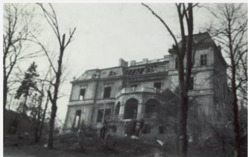
A kiégett Finn Nagykövetség 1945/46, kép közlése a Finn Nagykövetség engedélyével

felfelé anyám, a Szent Gellért-szobor felé, de azt már serdült koromban tette hozzá, hogy szeretett hegyünket a szent ember keresztet felemelő keze sem tudta megvédeni a háború borzalmaitól.