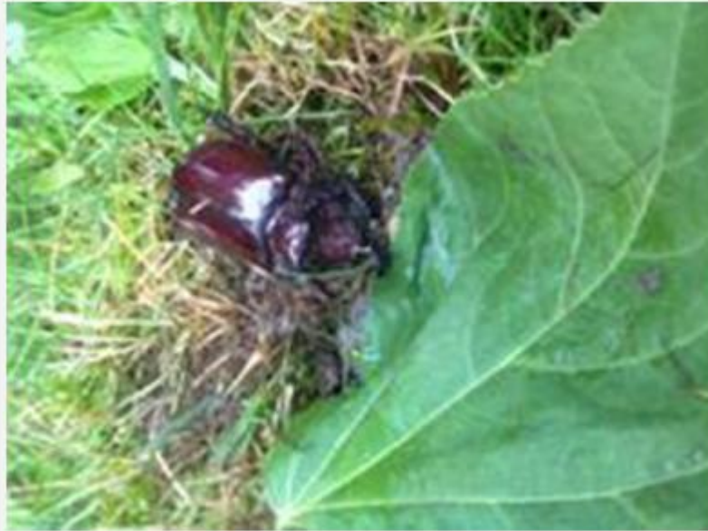
Egy, a múltat még szerencsésen túlélte, kiemelten védett orrszarvú bogár gellérthegyi egyede ( felv.:2013, Minerva utcai kert)

de sosem mondták, miért ne bújjam olykor-olykor nyíltan is a szent Bibliát? A hegyet akkori-ban erős hangú ószeresek, vándorbádogosok, köszörűsök járták, némelykor feltűnedeztek a vándorverklisek/sípládások, kik egész tudományukat és boltjukat jobbára hátukon cipelték. A