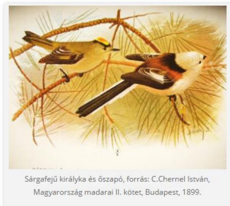
Sárgafejű királyka és őszapó, forrás: C.Chernel István, Magyarország madarai II. kötet, Budapest, 1899.

Az ősszel más, kis énekesmadarakkal bandákba verődő cinkefélékkel találkozunk. Az őszapók egyedszáma örvendetesen nő. A figyelmes szemlélődő olykor megpillanthatja a bokrok,