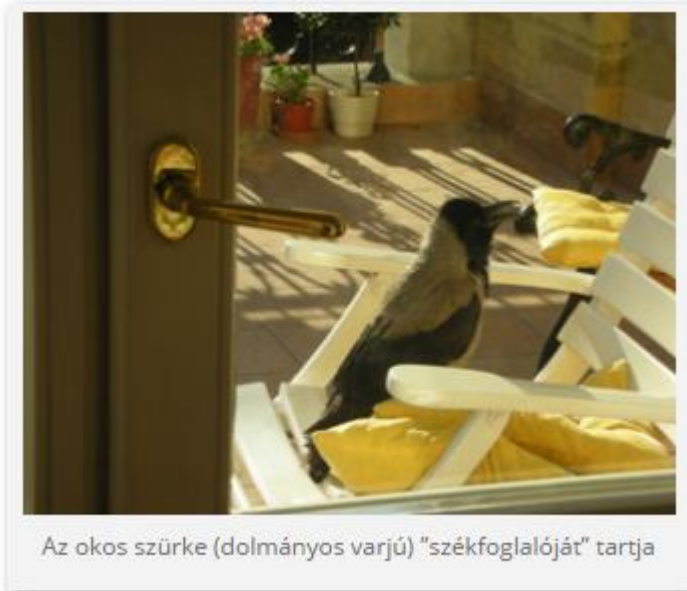
Az okos szürke (dolmányos varjú) "székfoglalóját" tartja

darak, akik mindig rálelnek a kertek vadrózsa bokrainak rászáradt termésére. A varjúfélék (sajnos a holló kivételével) közül a szajkók, a szarkák, a dolmányos/szürke varjak egyre nagyobb számban telepednek meg és válnak városlakó madarakká is. Tudom, fészekrablók is, de hát ők is élni akarnak, és valószínű, hogy híres tanulékonyosságuk révén már hallottak az