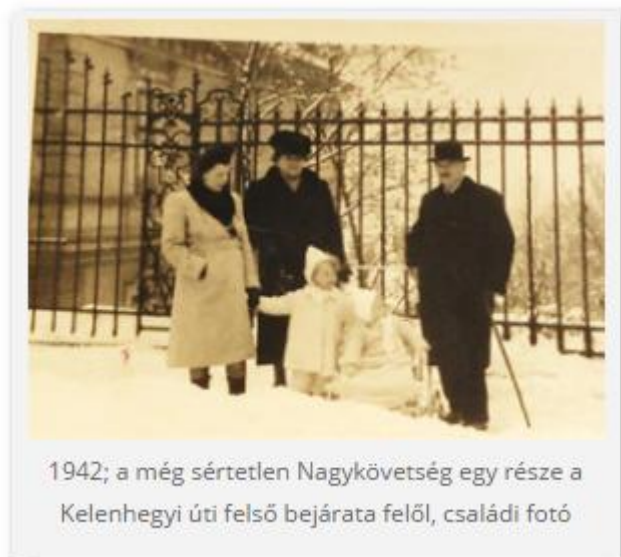
1942; a még sértetlen Nagykövetség egy része a Kelenhegyi úti felső bejárata felől, családi fotó

Amint az ember életének rokkáján vékonyodik a fonál, homokóráján pedig gyorsul a pergés, rá kell jönnöm hét évtizedre visszatekintve: minden és minden összefügg elődeinkkel, szű-