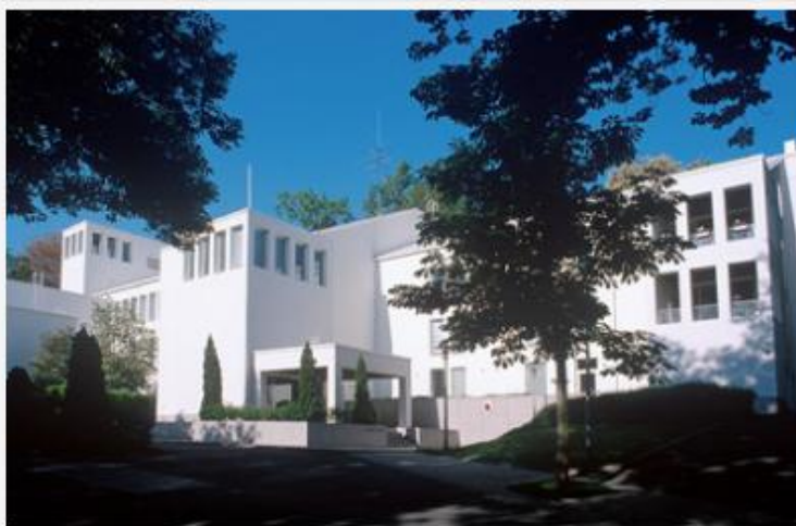
Az új

Első elemimet a kerületen kívül, a Váci utcai Angol kisasszonyok apácarend iskolájában (hét osztályzat volt még) végeztem. Ez idő tájt harmadik éve mehettünk át az 1945 januárjában felrobbantott Ferenc József híd (időben a harmadik, budapesti hidunk) helyetti újjáépített, immár a Szabadság elnevezésű hídon. (Ritkábban Fővám térinek is hívják). A romantikus