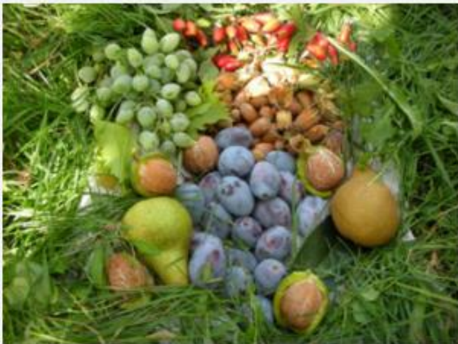
A biokert őszi „ajándékosara” 2015-ben

Óvjuk, vigyázzuk szeretett hegyünket, melynek mintegy 40 hektárnyi része 1987 óta az UNESCO Világörökség része, és 1997 óta természetvédelmi terület! A hegy a Duna-Ipoly Nemzeti Park Igazgatóságának kezelésében áll, a dolomitos sziklagyepen olyan fokozottan védett növények is előfordulnak, mint a kisleveles hangyabogáncs, a magyar gurgolya, a csikófark és a sárga habszegfű, utóbbi Magyarországon csak itt díszlik.