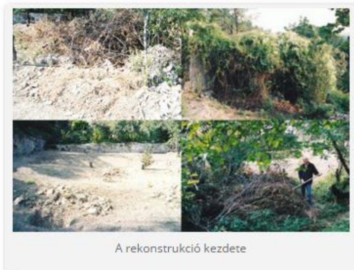
A rekonstrukció kezdete

lam. Nevével ellentétben a verébalkatúak rendjébe tartozik, ezen belül a sárgarigófélék családjába sorolandó. Gyönyörű madarunkat Márai Sándor, mint az állati nemesség vigasztaló jelenségeként említi „Napló 1943-44” című művében.