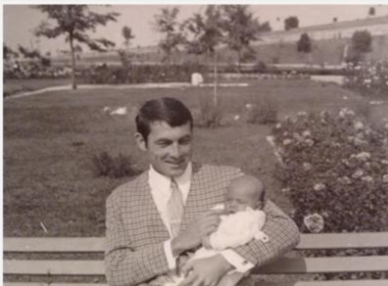
1970: a jubileumi park egy része, a még fiatal facsemetékkal

Későtavasza megérkeznek a bronzosan csillogó, pompázatos színű, de mégis egyszerűnek mondható seregélyek, az egyre kevesebb számú odúkat versengve foglalják el a tarkaharkályoktól; fakopáncsoktól. Igen ritkán, de feltűnik a veréb nagyságú, a legkisebb termetű európai fakopáncs is, a hátán sűrűn fehér-feketén keresztávozott kis tarkaharkály, a Dendrocopus minor . Több pár tekintélyes méretű zöld (hamvas) küllő is él a hegyen, „évtizedenként” egyszer látható Európa legnagyobb har-