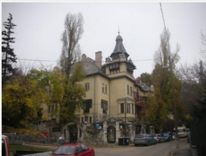
A volt Svéd Nagykövetség, R. W. egykori irodájával. Épült 1906-ban (A Pipacs utca első háza)

A Gellérthegy parcellázása a filoxéra járványt követően vette kezdetét, az 1910-es, 20-as évekre már nagy, akár hatalmas telkekkel övezett villák magasodtak. Közvetlen a szomszédunkban a Zwack villa állt, (az egykori Bayer villa) szomszédságában. A Pipacs - Minerva - Gyopár utcák hármassarkán a Svéd ház magasodik, itt mentette, és a szerencsétlen sorban állók részére állította ki Raoul Wallenberg százával a menleveleket, már amíg tehetett.