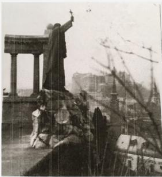
Szent Gellért vértanú klasszikus stílusú szobra 1904-ben készült el, alkotója Jankovics Gyula szobrászművész, családi felvétel, cc. 1933

Gellért-tér feletti Szikla templom (hivatalos neve Magyarok Nagyasszonya sziklatemplom) és lakói még rosszabb sorsra jutottak, az akkori hatalom a bejáratot 1951 Húsvét másnapján befalaztatta, a Pálos rend tagjait száműzte, börtönbe vetette, bányába küldte, a kegytárgyakat a Dunába szórták, Vezér Ferenc atyát felakasztatta.