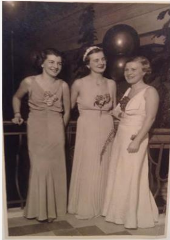
Bálozók a pezsgő fürdő emeletén; Medikus bál a Gellértben 1936. január 25-én, családi, saját tulajdonú fotó

stílusú kolostor épült meg mellé. Ide jártunk misére rendszeresen vasárnaponként, ameddig lehetett: gyerekek kerülő úton menjetek a 10-es misére, hallik nagyanyám aggódó hangja.